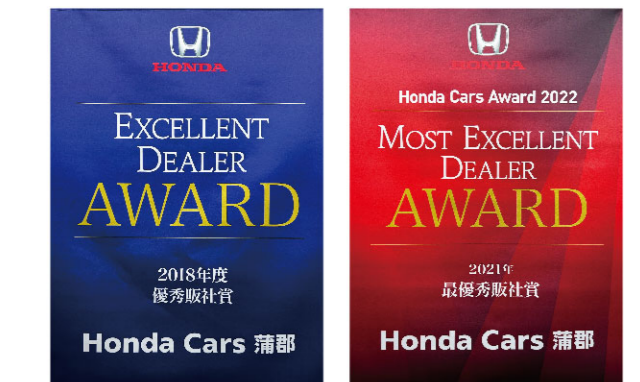
優秀販社賞 2018年度2019年度連続受賞 ※2 最優秀販社賞 2020年度・2021年度連続受賞 ※3